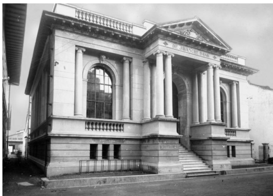
Gambar 3. De Javasche Bank Macassar

Klasifikasi mekanisme hilang disajikan pada Tabel 3 untuk membedakan kehilangan fisik dari kehilangan identitas dan kehilangan dokumentasi. Pada objek fokus, pembongkaran total menjadi mekanisme paling kuat. De Javasche Bank dan Nederlandsche Handel Maatschappij tidak lagi ditemukan secara fisik pada lingkungan Passerstraat , sementara keberadaannya pada masa lalu dibuktikan oleh Gambar 3 dan 4 di bawah. Gedung Koninklijke Paketvaart Maatschappij (KPM) Makassar juga tidak lagi hadir secara fisik dengan informasi hilangnya diperkuat rujukan kompilatif [3][4][6][7].