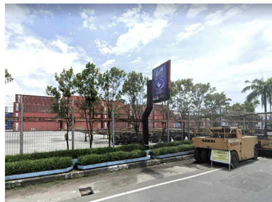
Gambar 4. Kawasan Pelabuhan Makassar saat ini, Tahun 2025