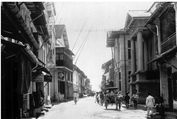
Gambar 1. De Passerstraat Macassar

Arsitektur Indische di Makassar merupakan salah satu bukti penting modernitas kolonial di Indonesia Timur, namun jejaknya pada kawasan pelabuhan mengalami pemutusan yang tajam. Selama ini pembacaan Indische di Indonesia lebih sering bertumpu pada bangunan yang masih berdiri, seolah olah peta Indische di luar Jawa memang sejak awal terbatas. Cara pandang ini problematis karena menjadikan ketiadaan fisik sebagai ketiadaan sejarah. Padahal Indische yang hilang tetap menyimpan data arsitektur yang dapat dibaca untuk mengukur skala kehilangan dan menata ulang pemahaman tipologi Indische di Makassar [1][2].