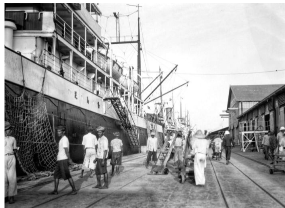
Gambar 2. Haven van Macassar, 1934