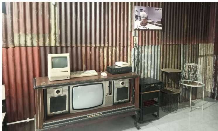
Gambar.1 Material Dinding dan Perabot

Dalam penelitian ini, metode yang digunakan adalah metode kualitatif dengan mengumpulkan informasi aktual secara rinci dan sistematis, fakta atau karakteristik populasi tertentu atau bidang tertentu berupa ciri, sifat, keadaan, atau gambaran dari kualitas objek yang diteliti. Pendekatan studi dilakukan dengan konsep ramah lingkungan dan greenship pada bangunan yang menekankan pada ategori Material Resources and Cycle (MRC) atau sumber dan siklus material. Pengumpulan data teori dan literatur berupa pengetahuan mengenai hubungan teori dan pembahasan perancangan arsitektur bangunan yang ramah lingkungan seperti Greenship untuk Gedung Baru Versi 1.1 dan Greenship untuk Bangunan Baru Versi 1.2. Data tersebut kemudian dibandingkan dengan data yang didapat pada saat observasi secara langsung ke lapangan. Adapun prosedur penelitian mencakup kegiatan persiapan, pengumpulan data baik literatur maupun data lapangan. Kegiatan dilanjutkan dengan pengolahan dan analisa data berdasarkan aspek greenship GBCI dengan menekankan siklus dan sumber material untuk mendapatkan kesimpulan penilaian.