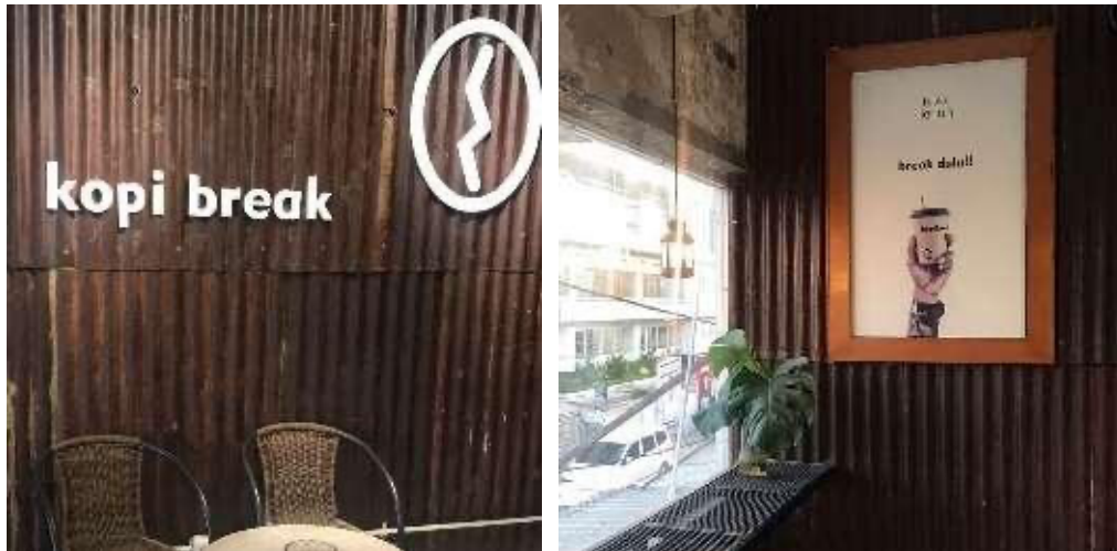
Gambar.4 Penggunaan Material Bekas

Penggunaan gedung dan material bekas ini adalah salah satu syarat GBCI dengan tujuan memperpanjang daur hidup material dan mengurangi sampah konstruksi yang dimana tolak ukurnya yaitu menggunakan material bekas. Kafe ini menggunakan bangunan lama dan juga menerapkan penggunaan material bekas pada interior bangunannya dan juga furniturnya. Pada dinding menggunakan material bekas berupa seng atap. Penggunaan material tersebut diterapkan pada lantai 1 dan lantai 2 bangunan.