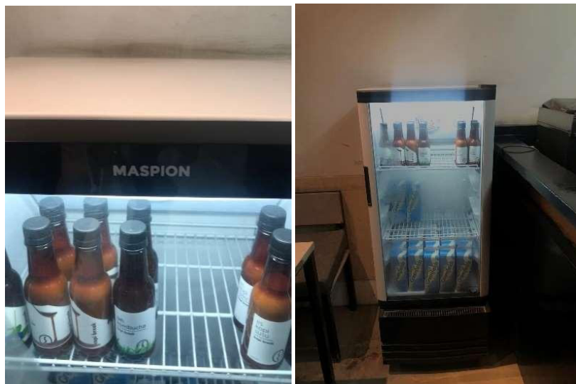
Gambar.3 Lemari Pendingin Sumber : Hasil Survey, Mei 2024

Fundamental Refrigerant merupakan kriteria prasyarat dalam sistem rating GreenShip dengan tolak ukur tidak menggunakan chloro fluoro-carbon (CFC) sebagai refrigeran dan halon sebagai bahan pemadam kebakaran. Dengan tujuan menghindari penipisan lapisan ozon karena penggunaan BPO. Menghindari penipisan lapisan ozon karena penggunaan BPO pada refrigerant. (Sulistiawan 2020). Pada studi kasus penelitian ini yaitu di kafe Kopi Break, cafe ini menggunakan refrigerant berupa freezer merek Maspion, yang dimana freezer ini menggunakan CFC sebagai senyawa pendingin kulkas.