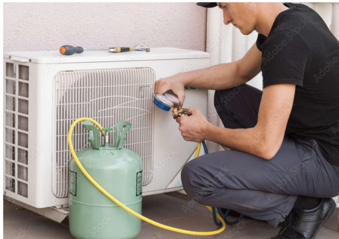
Gambar.5 Penggunaan AC Tanpa ODP

Tolak ukur dalam kriteria yang keempat ini adalah tidak menggunakan bahan perusak ozon pada seluruh sistem pendingin gedung dengan tujuan menggunakan bahan yang tidak memiliki potensi merusak ozon. Menurut Peraturan Menteri Perindustrian No.33/MIND/PER/4/2007 tentang larangan memproduksi barang yang menggunakan bahan perusak lapisan ozon, (Sulistiawan 2020).