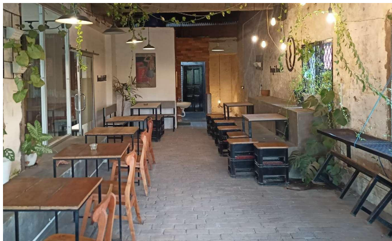
Gambar.5 kondisi ruangan Sumber : Hasil Survey, Mei 2024

bangunan café Kopi Break yaitu material Atap seng yang diaplikasikan pada bagian hampir seluruh bangunan, dan mempertahankan kondisi asli seperti tidak dicat ulang maupun ditambahkan insulasi panas.