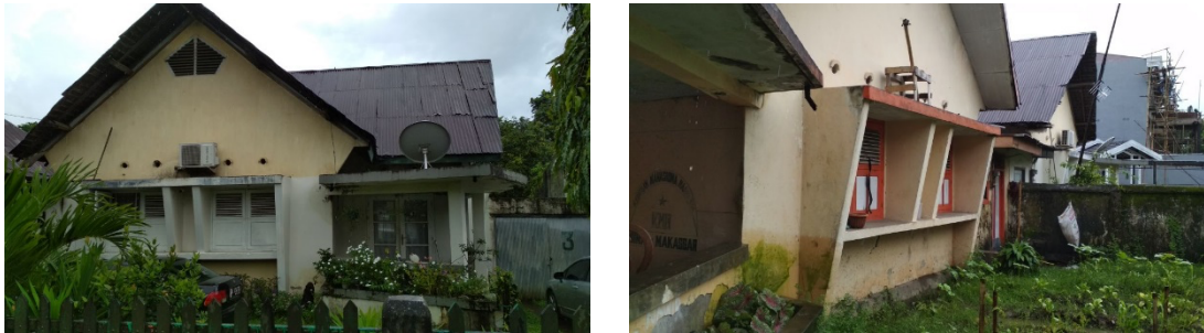
Gambar 6. Bukaan pada rumah bergaya arsitektur jengki

Pada rumah arsitektur jengki ini terlihat Dinding bagian tepi miring ke luar yang menyempit kebawah sehingga membentuk trapesium atau membentuk bidang segi lima mirip dengan simbol TNI AU.