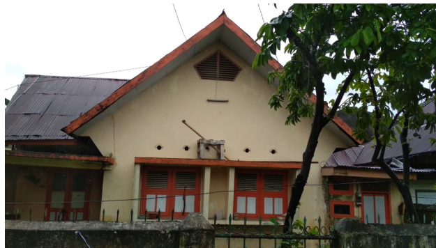
Gambar 5. Bentuk dinding rumah bergaya arsitektur jengki

Ciri khas bentuk atap arsitektur jengki yaitu berbentuk pelana, pada rumah ini terlihat jelas bentuk atap pelana yang digunakan. Selain atap pelana juga menggunakan atap datar untuk teras atau beranda. Beranda sebagai penanda pintu masuk ke dalam bangunan yang biasa disebut dengan portico. Atap datar memberi tekanan perbedaan dengan bangunan utama yang beratap pelana. Selain itu beranda berfungsi sebagai ruang penerima, ruang peneduh, ruang penyejuk untuk interiornya.