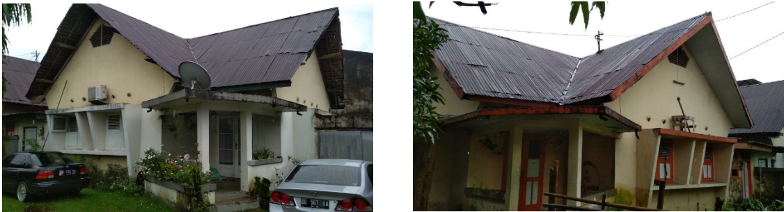
Gambar 4. Bentuk atap rumah bergaya arsitektur jengki

Rumah yang ada di jalan Bonto Mangapa ini merupakan salah satu rumah yang ada di kota Makassar yang bergaya arsitektur jengki, terdapat dua rumah (couple) yang satunya sudah tidak terpakai atau dalam keadaan kosong, sedangkan yang satunya lagi masih difungsikan oleh pemiliknya.