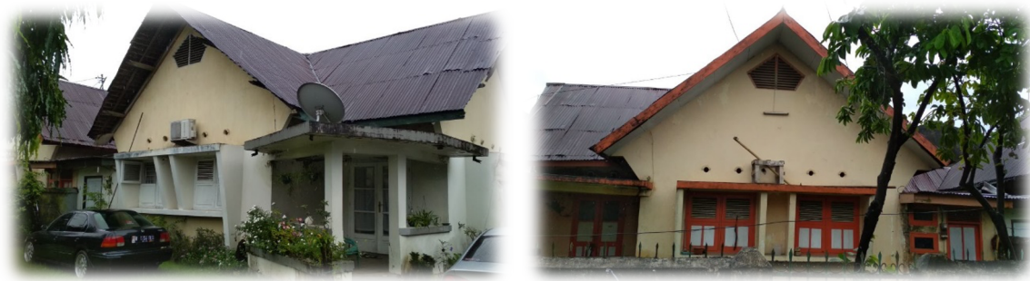
Gambar 3. Rumah couple yang bergaya arsitektur jengki

Rumah yang ada di jalan Bonto Mangapa ini merupakan salah satu rumah yang ada di kota Makassar yang bergaya arsitektur jengki, terdapat dua rumah (couple) yang satunya sudah tidak terpakai atau dalam keadaan kosong, sedangkan yang satunya lagi masih difungsikan oleh pemiliknya.