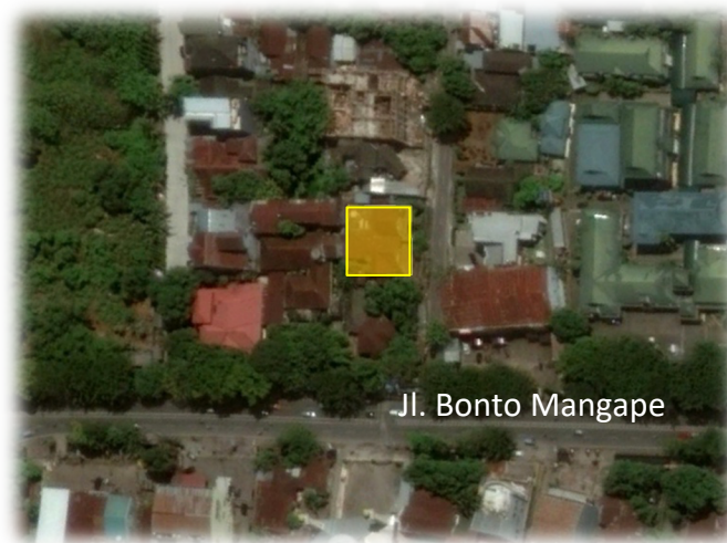
Gambar 2. Peta Lokasi

Lokasi penelitian arsitektur jengki di Makassar ini terletak di Jalan Bonto Mangape yang berbatasan dengan Jalan Sultan Alauddin.