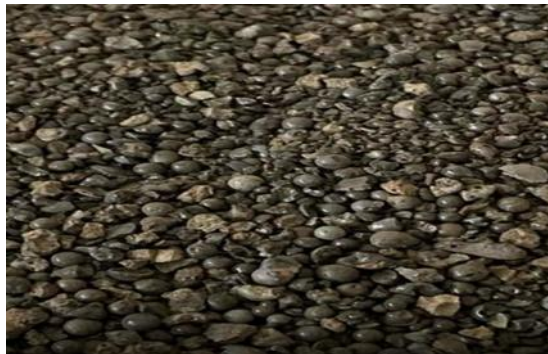
Gambar 2. Slag Nikel PT. HNI Bantaeng Sulawesi Selatan

Langkah – Langkah pengujian saringan untuk agregat halus (Slag Nikel) :