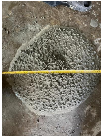
Gambar 3. Nilai Slump Test untuk Beton SCC

Slag Nikel memiliki komposisi kimia yang bervariasi tergantung pada jenis bijih dan proses peleburan, namun umumnya didominasi oleh silika ( \text{SiO}_2 ) dan magnesium oksida ( \text{MgO} ), yang dapat mencapai persentase signifikan, serta besi ( \text{Fe} ) dalam bentuk oksida. Selain itu, material ini juga mengandung sejumlah kecil oksida dari berbagai elemen lain seperti aluminium ( \text{Al}_2\text{O}_3 ), kalsium ( \text{CaO} ), kromium ( \text{Cr} ), mangan ( \text{Mn} ), dan bahkan sisa nikel ( \text{Ni} ) yang tidak terekstraksi sepenuhnya, serta unsur-unsur jejak lainnya. Kandungan silika yang tinggi ini menjadikan slag nikel menarik untuk berbagai aplikasi, termasuk sebagai bahan pengganti agregat dalam konstruksi atau sebagai sumber silika, meskipun keberadaan logam berat tertentu dalam konsentrasi yang bervariasi memerlukan evaluasi ketat untuk memastikan keamanannya dalam pemanfaatan ulang.